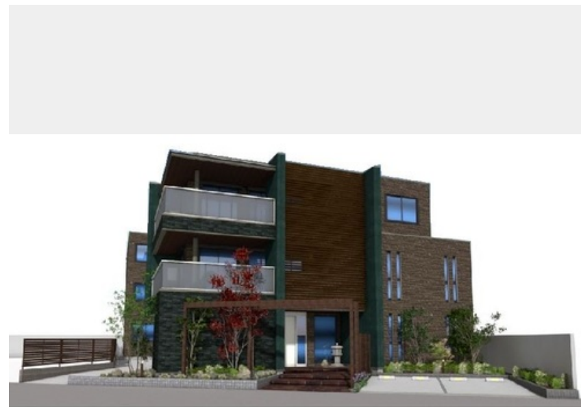
※完成イメージ図の為、色や仕様は現況が優先されます。