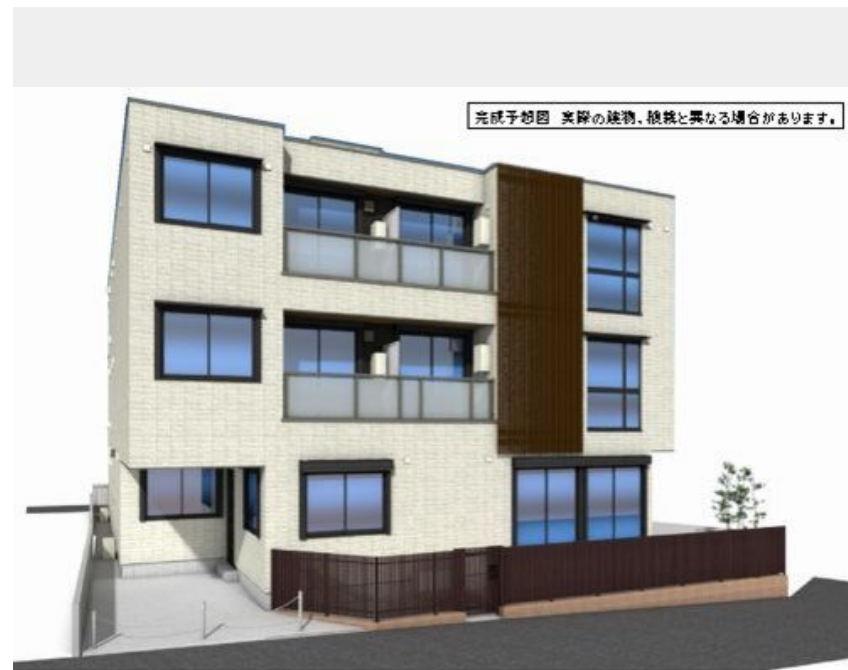
完成予想図 実際の建物、仕様と異なる場合があります。