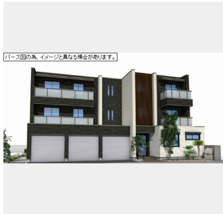
パース図の為、イメージと異なる場合があります。