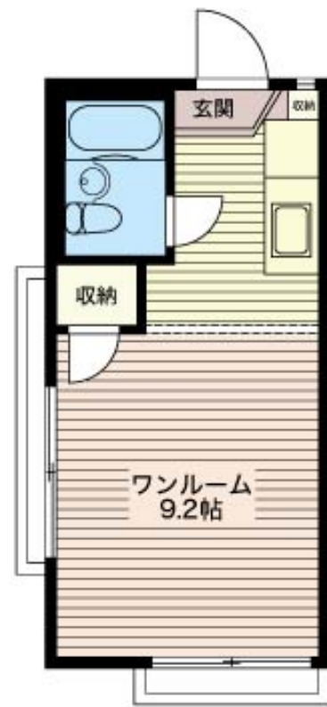
積水ハウスの賃貸住宅 シャーメゾン