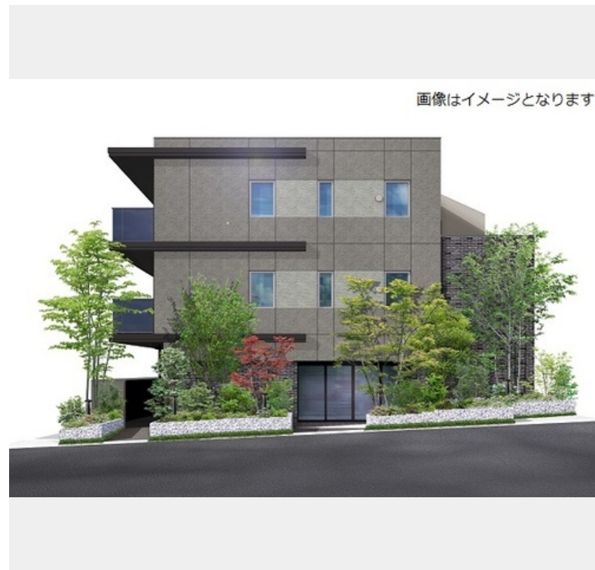
画像はイメージとなります