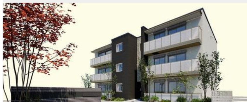
完成予想図のため、実際とは異なる場合がございます。また、絵图中的の周辺環境・植栽・空はイメージです。