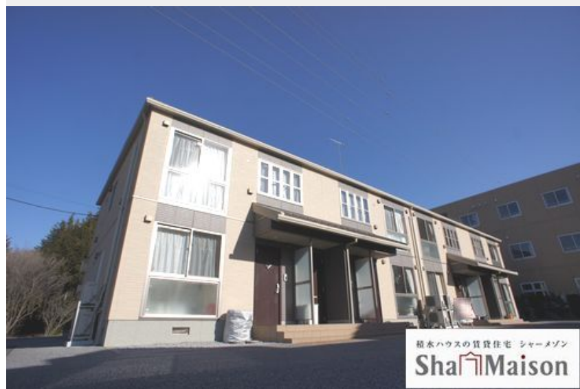
積水ハウスの賃貸住宅 シャーメゾン Sha Maison