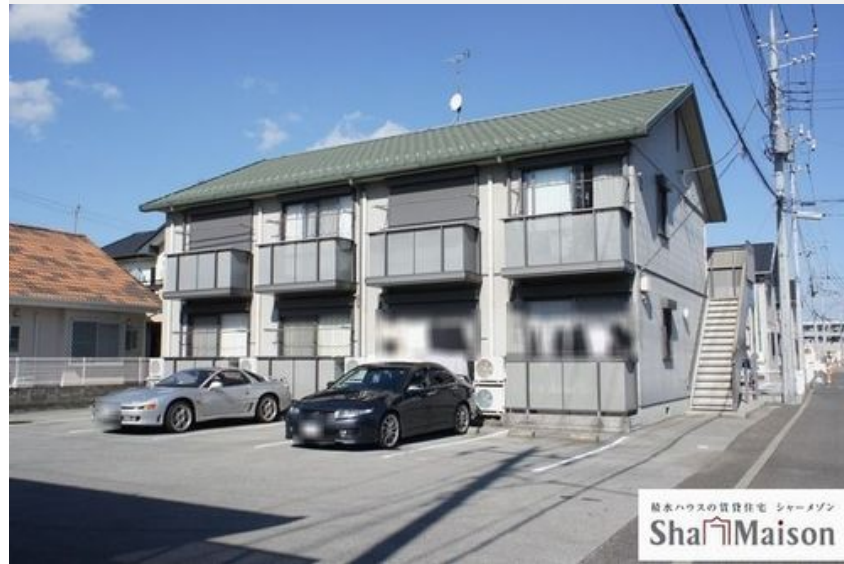
積水ハウスの賃貸住宅 シャーメゾン Sha Maison