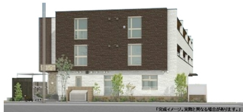
「完成イメージ。実際と異なる場合があります。」