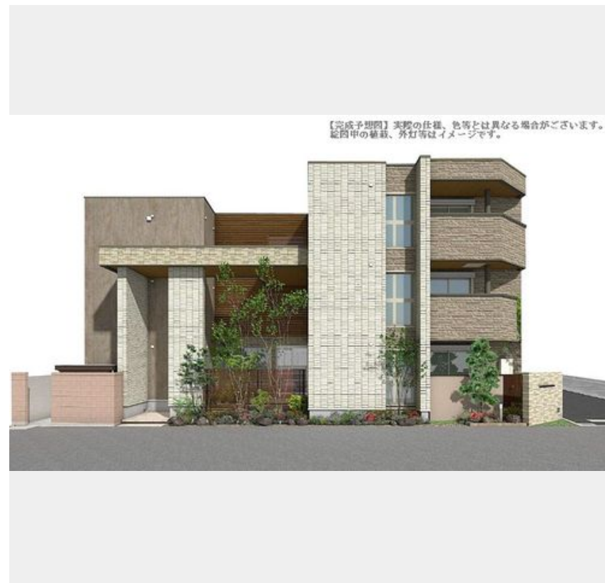
【完成予想図】実際の仕様、色等とは異なる場合がございます。図面中の植栽、外灯等はイメージです。