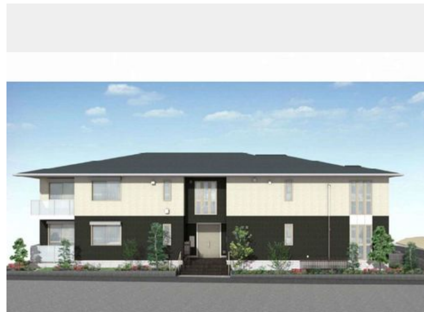
完成予想図。実際の建物と異なる場合がございます。