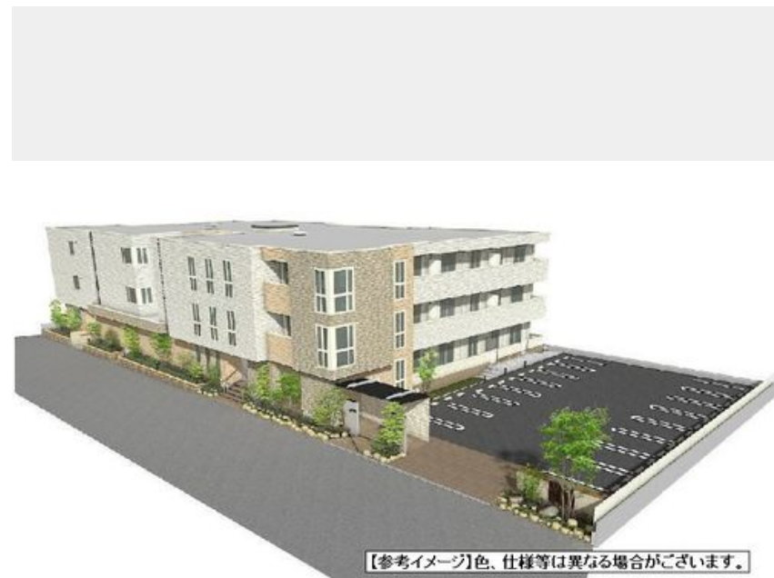
【参考イメージ】色、仕様等は異なる場合がございます。