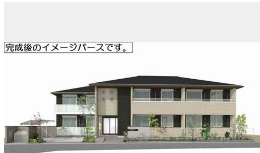
完成後のイメージパースです。