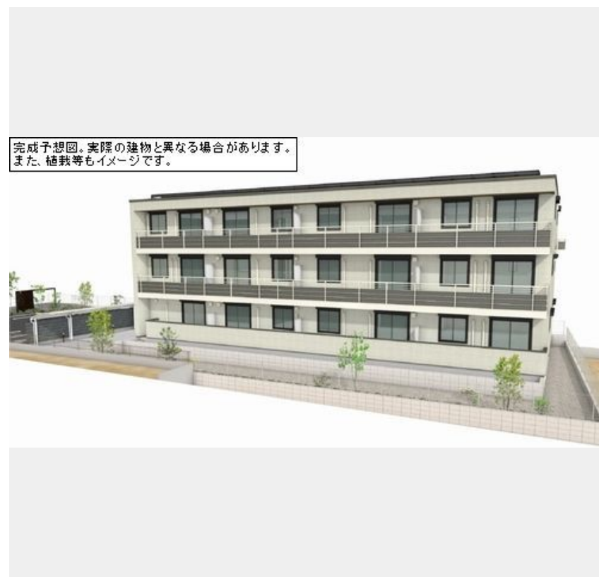
完成予想図。実際の建物と異なる場合があります。また、植栽等もイメージです。