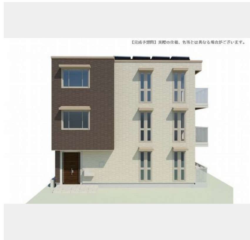
【完成予想図】実際の仕様、色等とは異なる場合がございます。