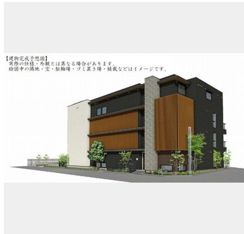
【建物完成予想図】 実際の仕様・外観とは異なる場合があります。 絵图中的の隣地・空・駐輪場・ゴミ置き場・植栽などはイメージです。