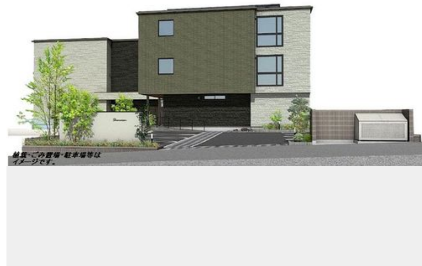
植栽・ごみ置場・駐車場等はイメージです。