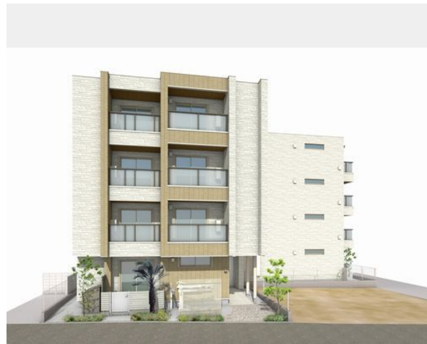
外観イメージです。色・外観・仕様につきましては変更となる場合がございます。