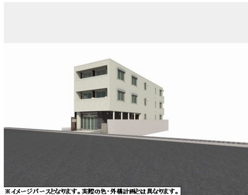
※イメージバースとなります。実際の色・外構計画とは異なります。