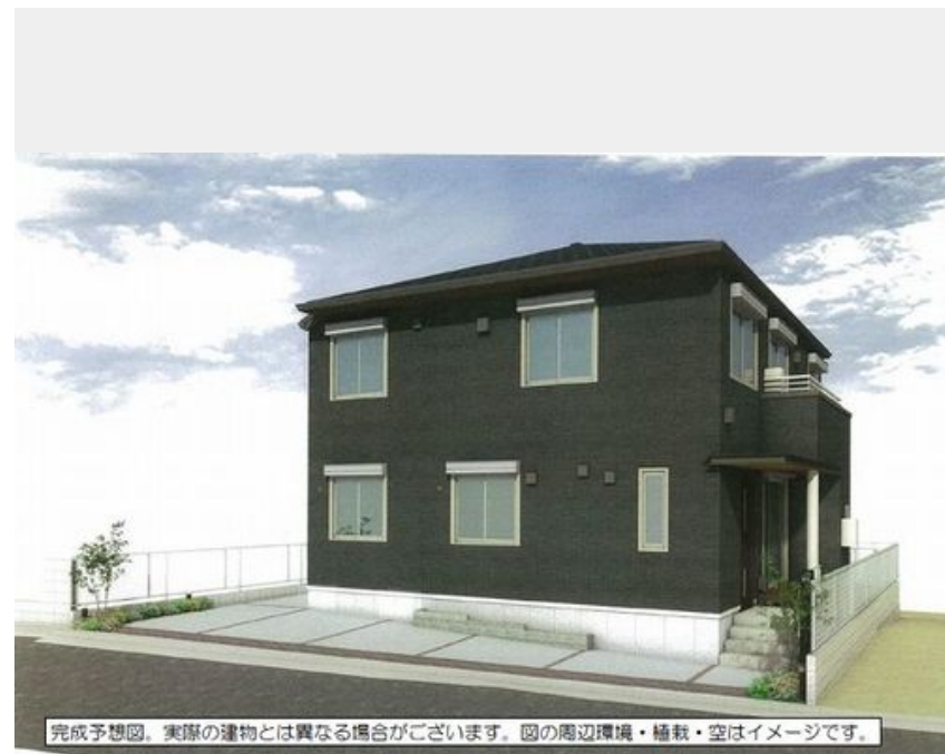
完成予想図。実際の建物とは異なる場合がございます。図の周辺環境・植栽・空はイメージです。