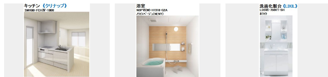
キッチン (クリナップ)