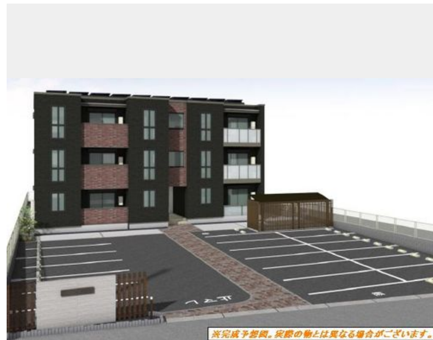
*完成予想図。実際の物とは異なる場合がございます。