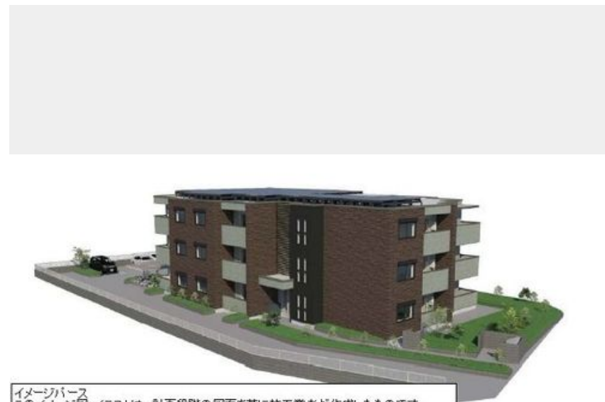
イメージパース このイメージ・イラストは、計画段階の図面を基に施工業者が作成したものです。 設計施工上の理由などにより変更となる場合があります。変更の場合は現状有姿とします。