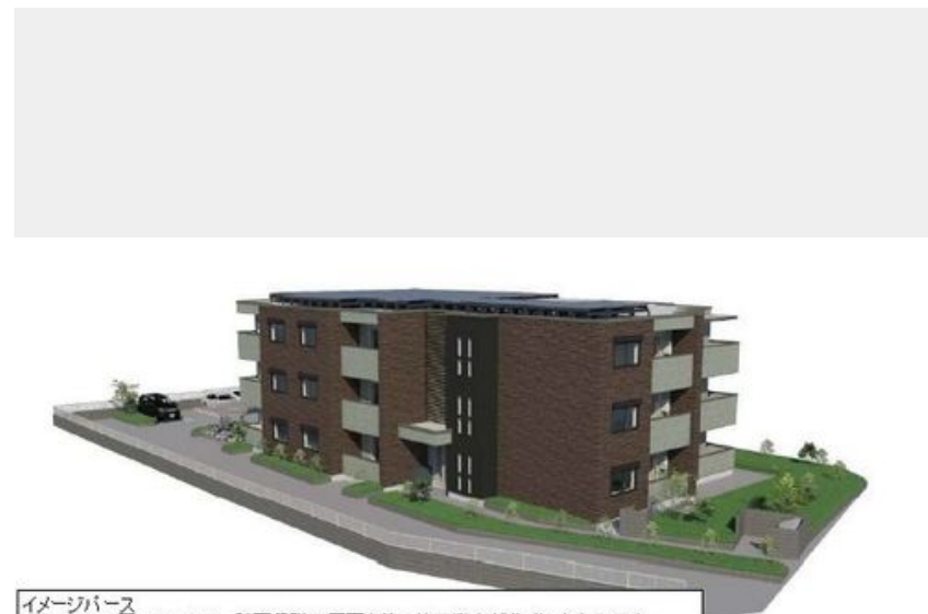
イメージパース このイメージ図・イラストは、計画段階の図面を基に施工業者が作成したものです。 設計施工上の理由などにより変更となる場合があります。変更の場合は現状有姿とします。