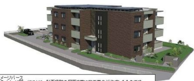
イメージパース このイメージ図・イラストは、計画段階の図面を基に施工業者が作成したものです。 設計施工上の理由などにより変更となる場合があります。変更の場合は現状有姿とします。