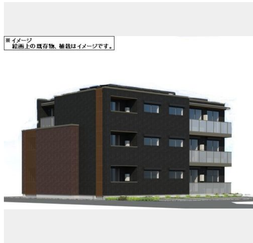
※イメージ 絵画上の既存物、植栽はイメージです。