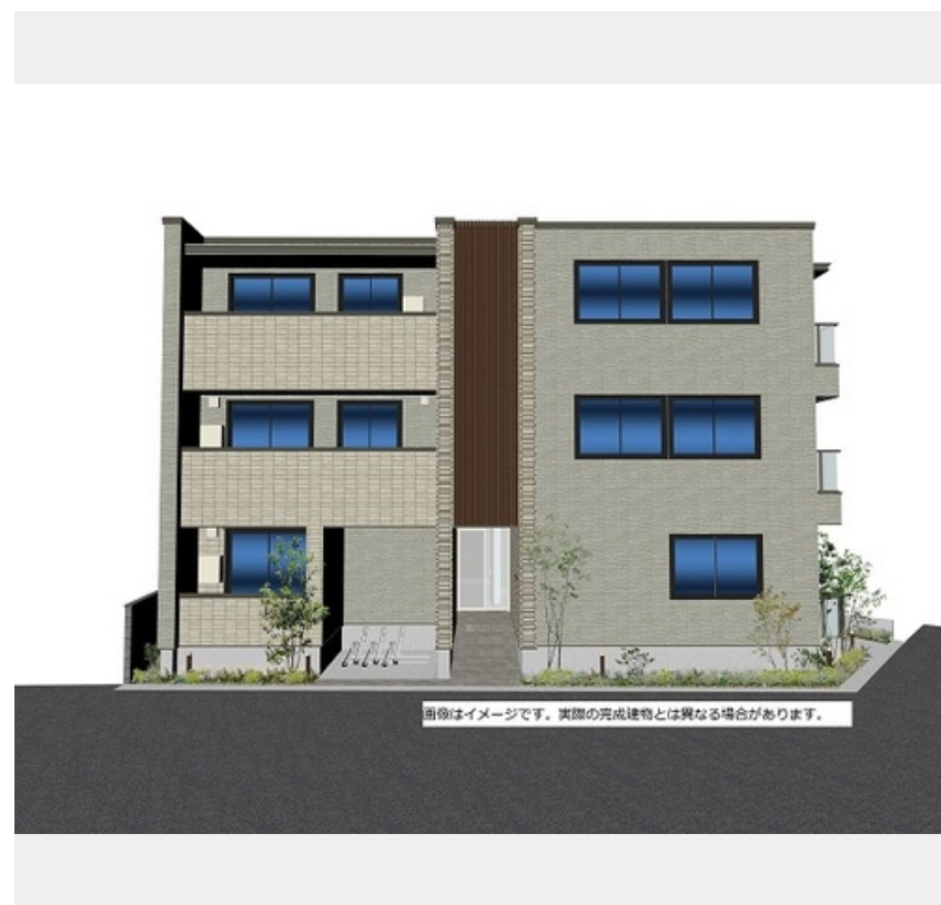
画像はイメージです。実際の完成建物とは異なる場合があります。