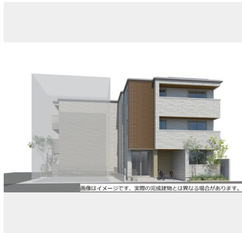
画像はイメージです、実際の完成建物とは異なる場合があります。