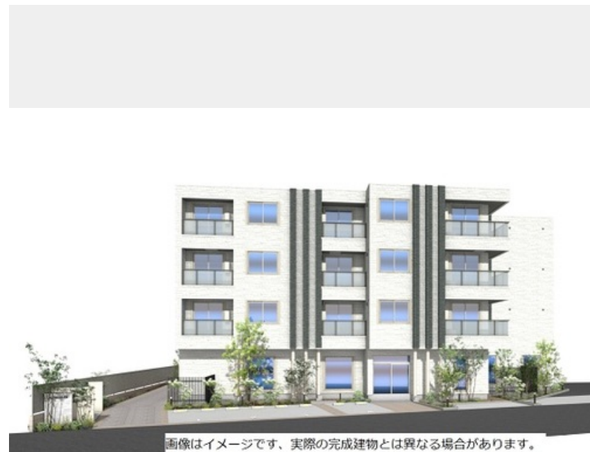
画像はイメージです。実際の完成建物とは異なる場合があります。