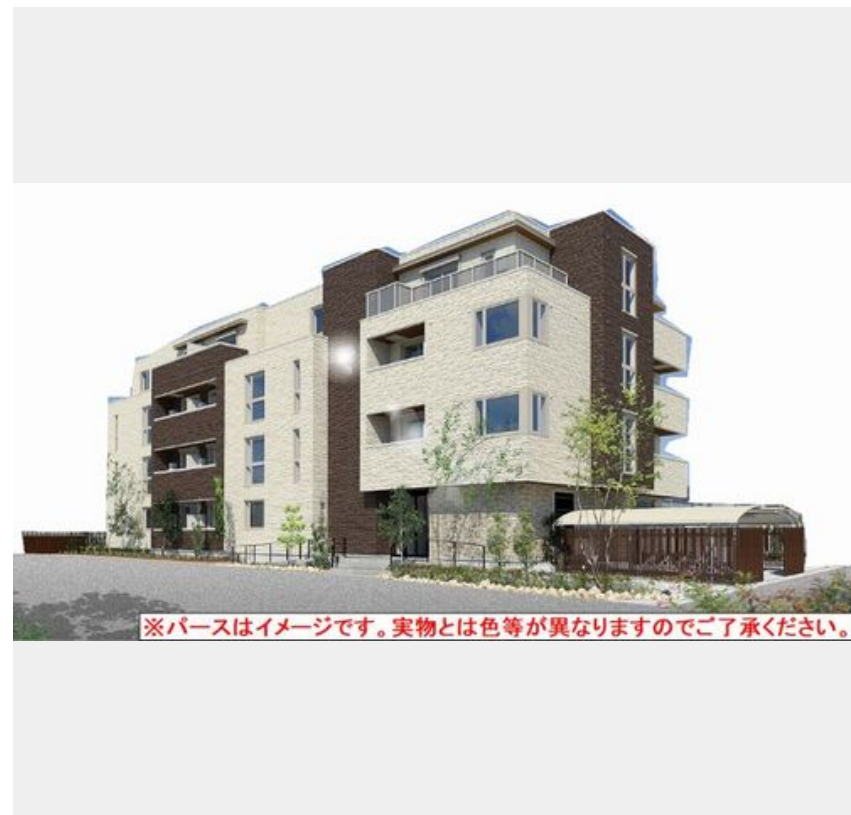
※パースはイメージです。実物とは色等が異なりますのでご了承ください。