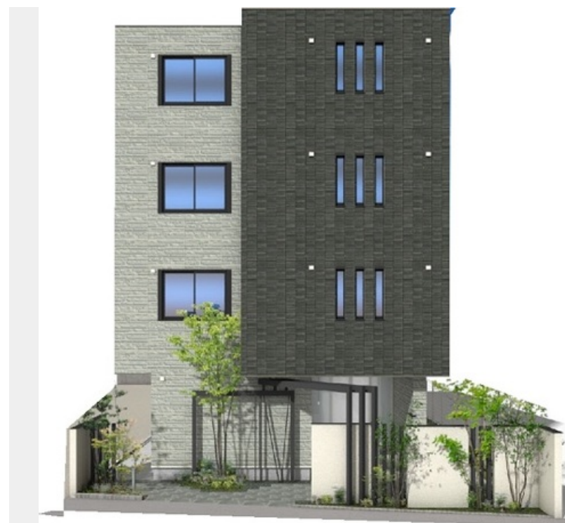
こちらはイメージになります。実物とは色合いや質感が異なる場合がございます。ご了承ください。