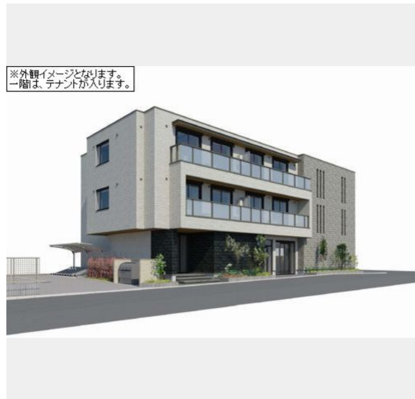
※外観イメージとなります。一階は、テナントが入ります。