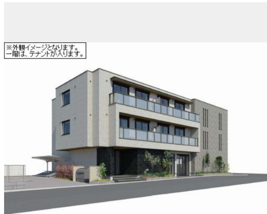
※外観イメージとなります。一階は、テナントが入ります。