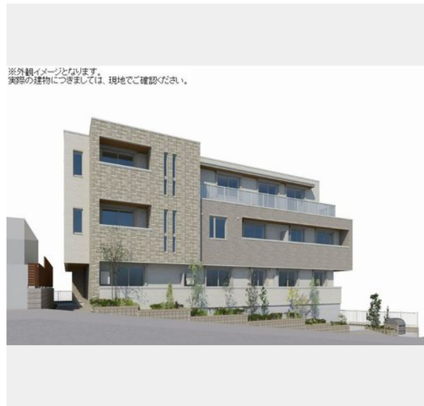
※外観イメージとなります。実際の建物につきましては、現地でご確認ください。