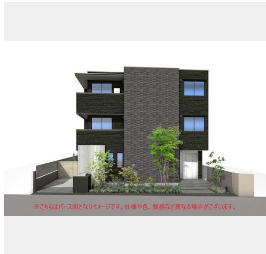
※こちらはパース図となりイメージです。仕様や色、質感など異なる場合がございます。