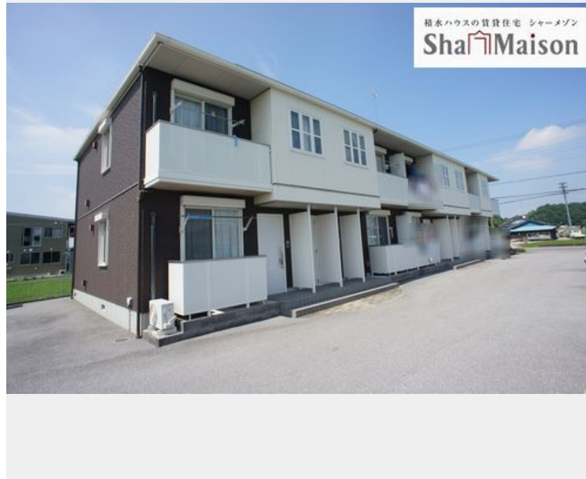
積水ハウスの賃貸住宅 シャーメゾン Sha Maison