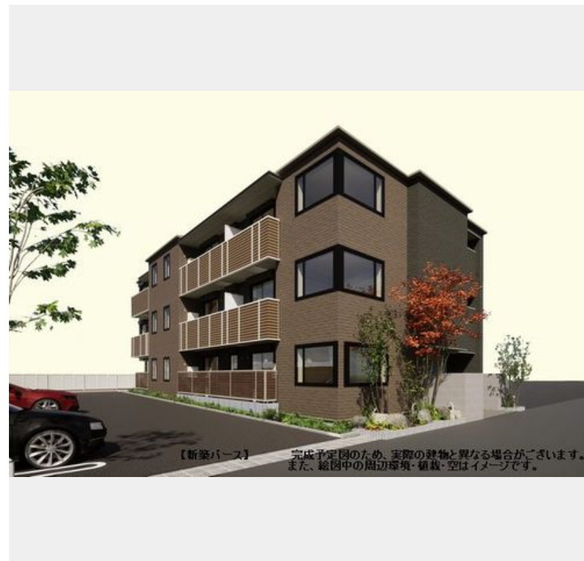
【新築バス】完成予定図のため、実際の建物と異なる場合がございます。また、総图中的周辺環境・植栽・空はイメージです。