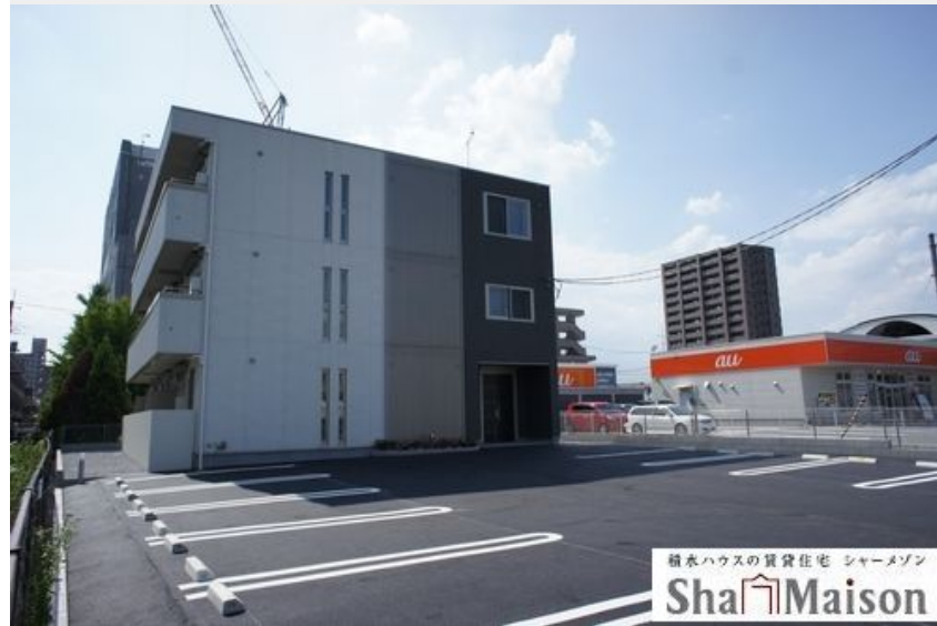
積水ハウスの賃貸住宅 シャーメゾン Sha Maison