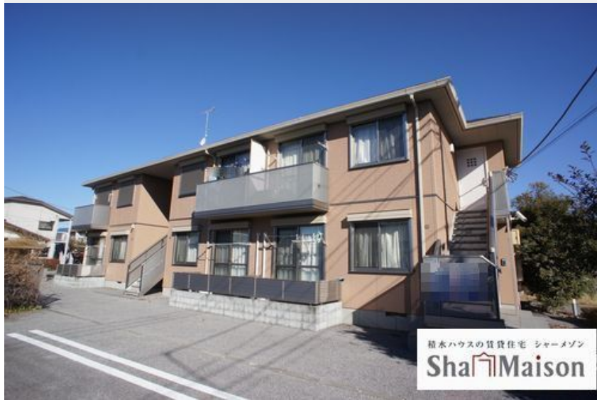
積水ハウスの賃貸住宅 シャーメゾン Sha Maison