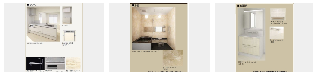
【完成イメージ。実際と異なる場合があります。】