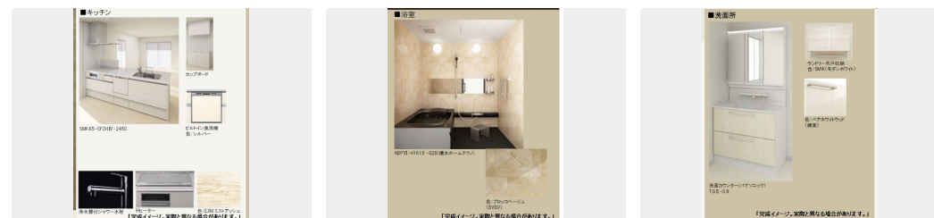
【完成イメージ。実際と異なる場合があります。】