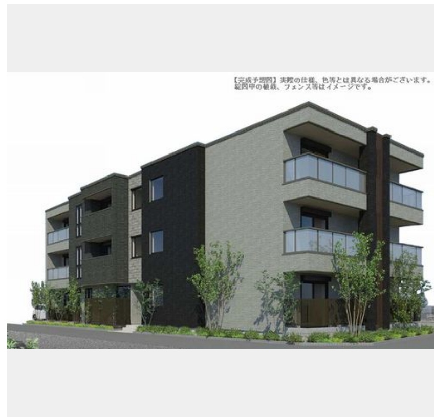
【完成予想図】実際の仕様、色等とは異なる場合がございます。総画中の植栽、フェンス等はイメージです。