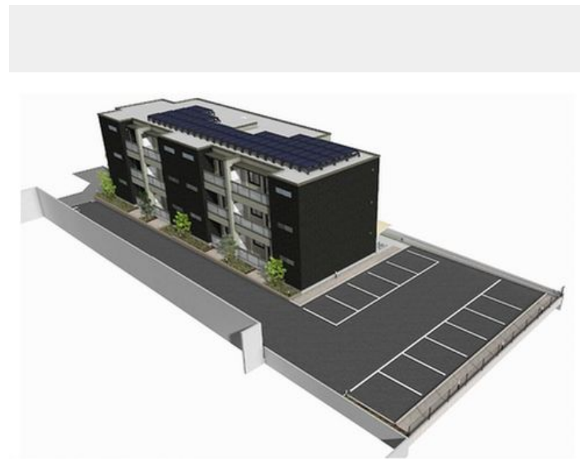
※この画像はイメージとなります。植栽等、実際とは異なる場合があります。