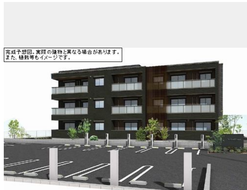
完成予想図。実際の建物と異なる場合があります。また、植栽等もイメージです。