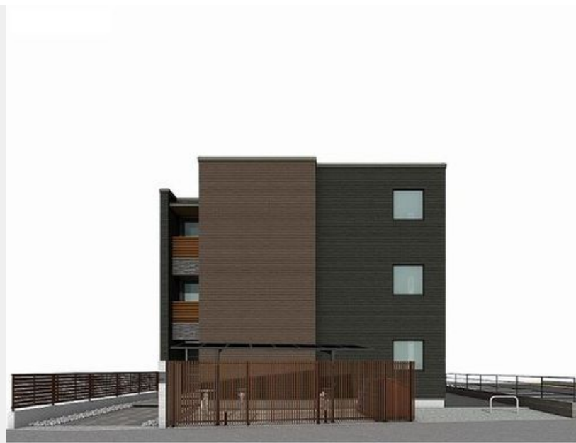
【建物完成予想図】 実際の仕様・外観とは異なる場合があります。 絵図中の駐輪場・ゴミ置き場などはイメージです。