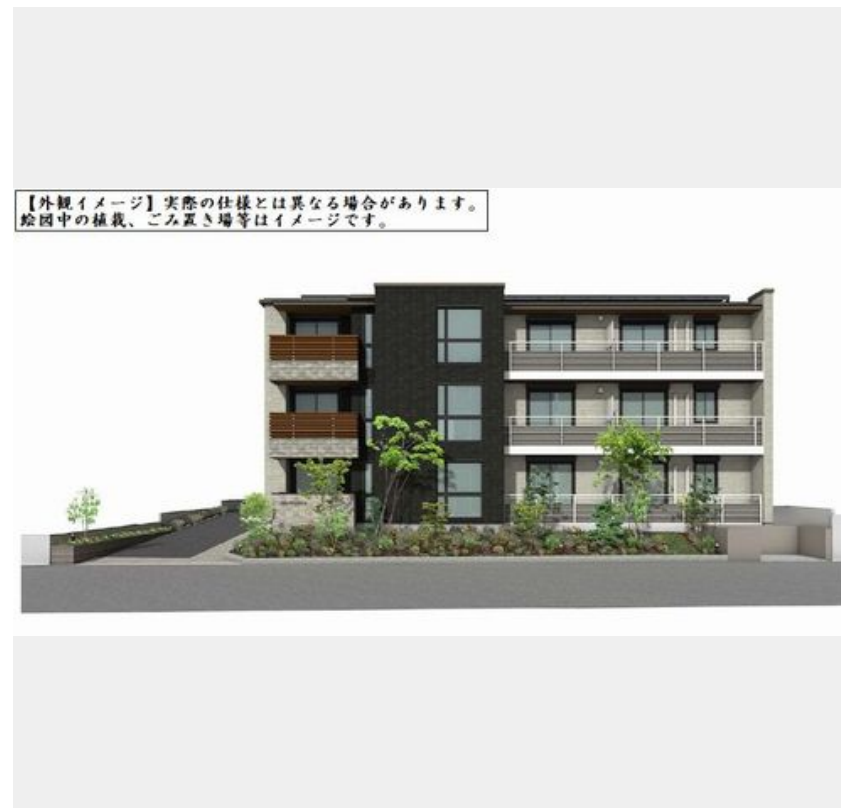
【外観イメージ】実際の仕様とは異なる場合があります。絵图中的の植栽、ごみ置き場等はイメージです。