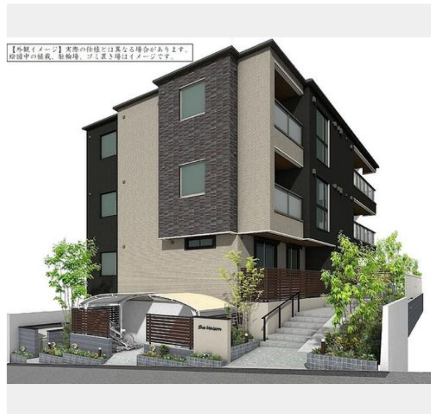
【外観イメージ】実際の仕様とは異なる場合があります。図面中の植栽、駐輪場、ゴミ置き場はイメージです。