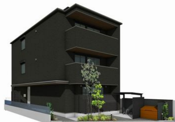
【外観イメージ】実際の仕様・設備とは異なる場合があります。図中の植栽、ごみ置き場、駐輪場はイメージです