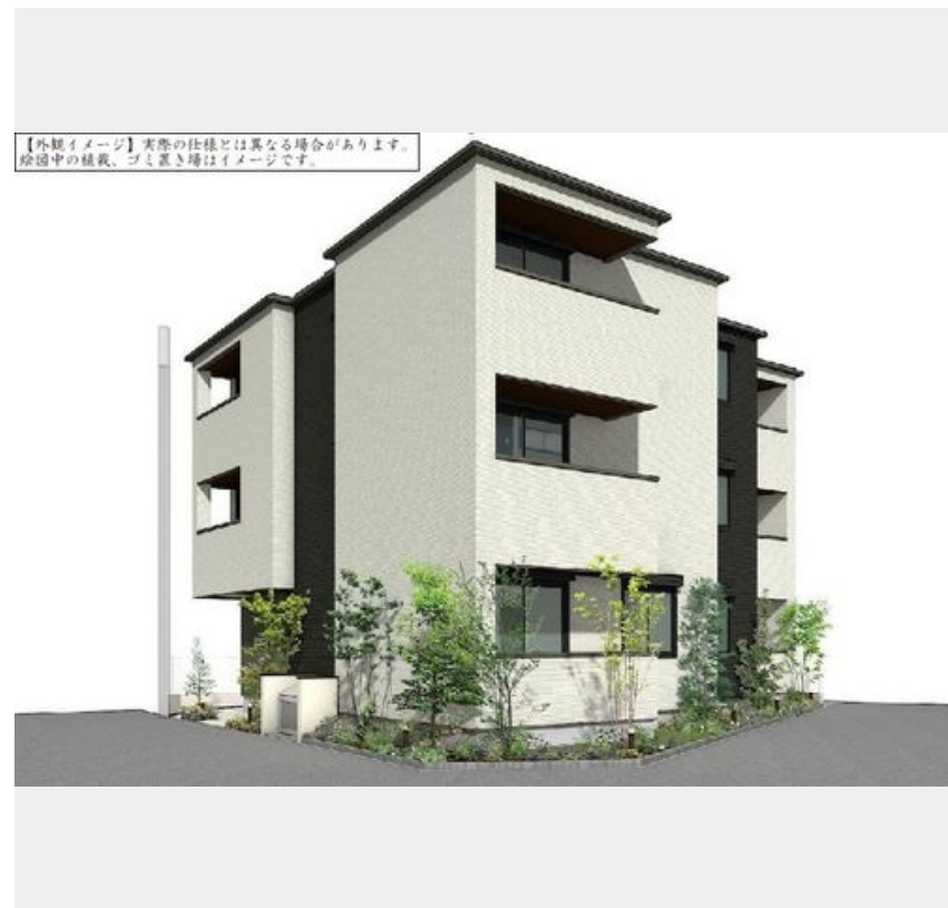
【外観イメージ】実際の仕様とは異なる場合があります。除却中の植栽、ゴミ置き場はイメージです。