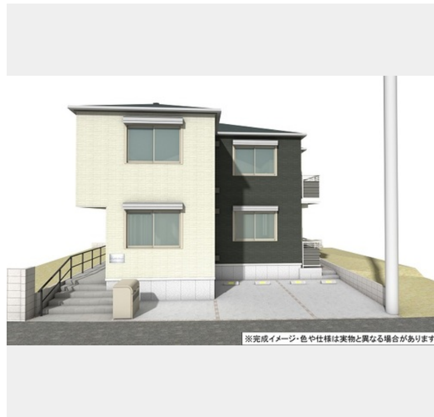
※完成イメージ・色や仕様は実物と異なる場合があります